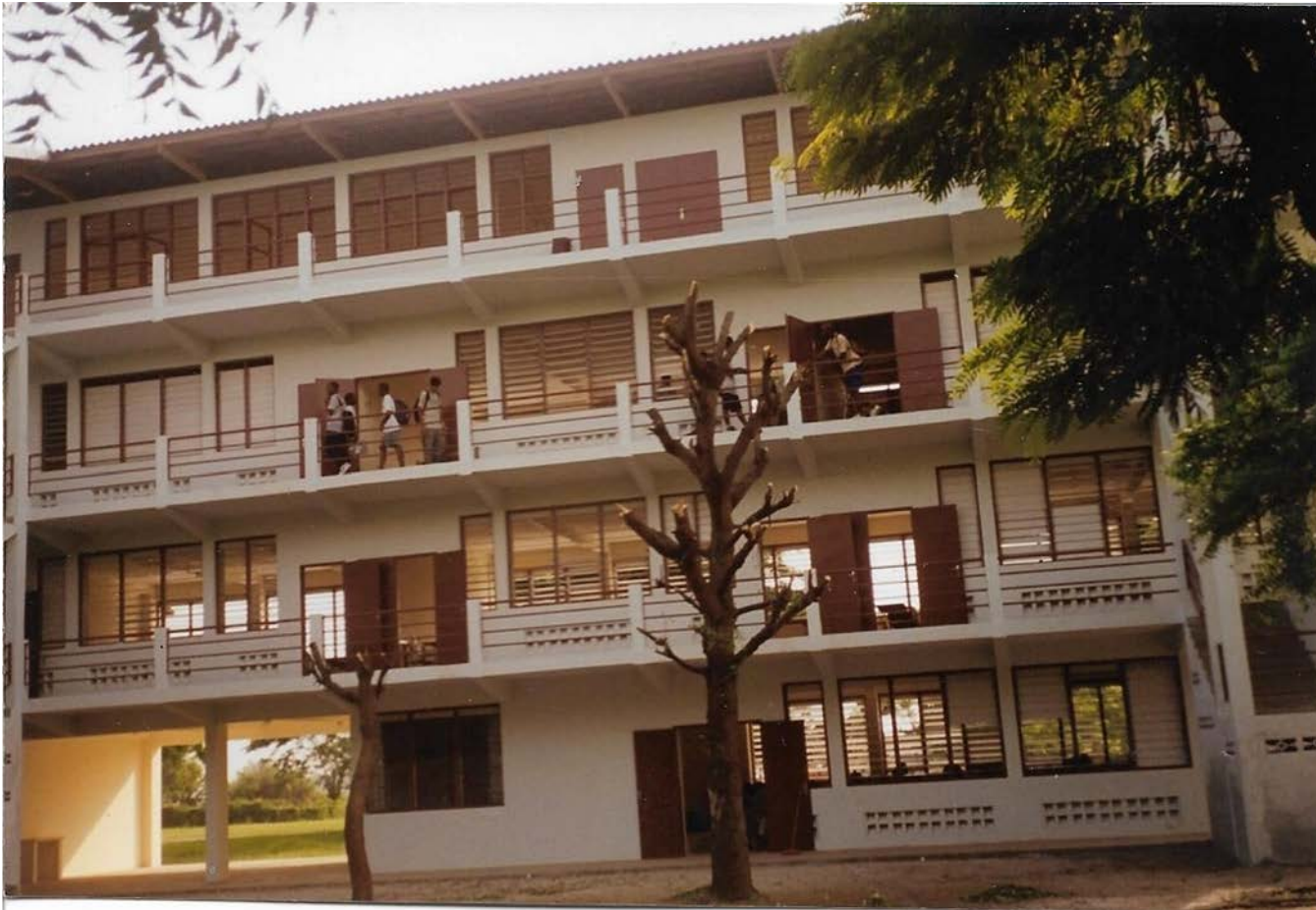
Colegio de Costa de Marfíl