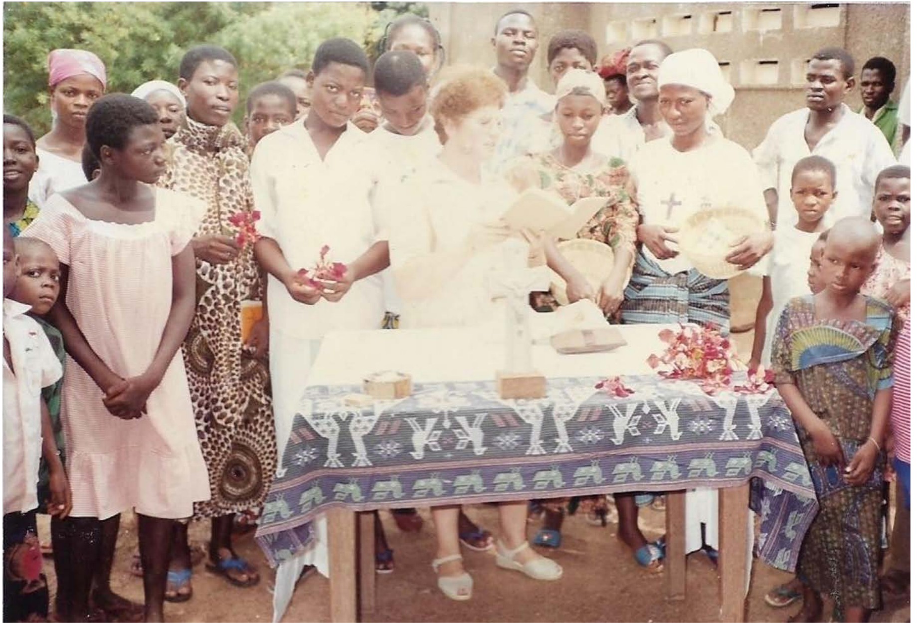
Celebración de la Palabra en comunidad